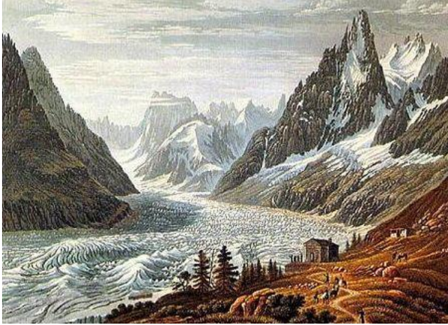
Mer de Glace / Marc Theodore Bourrit

Özellikle dağcılık ve doğa sporları açısından dünyanın önemli alanlarından olan ve her yıl binlerce turist tarafından ziyaret edilen Alp dağları coğrafyası dünya üzerinde yaklaşık 300.000 km 2 lik alana sahiptir. İsviçre, Kuzey İtalya ve Fransa sınırları içerisinde yer alan ve Avusturya'nın hemen hemen tamamını kapsayan, Güney Almanya önemli bölümünde görülen sıradağ coğrafyası başta dağcılık sporu başta olmak üzere, kayak, trekking, hikking yanı sıra şehrin yanında aniden yükselen sarp yamaçlar ile yamaç paraşütü gibi sporların yapıldığı, dünyanın merkezlerinden birisi olmakla birlikte, 17.yy'da dünya da teknik dağcılığın doğduğu topraklar olarak tarihte önemli bir yeri vardır.